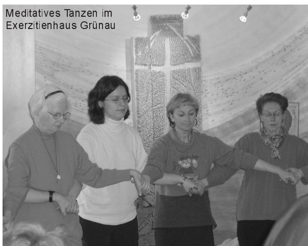
Meditatives Tanzen im Exerzitienhaus Grünau